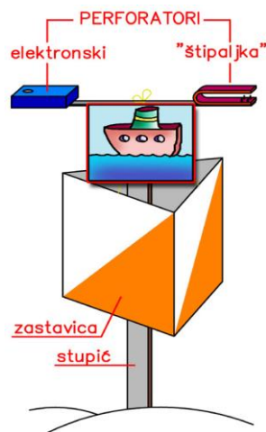
izgled kontrolne točke

Kontrolne točke obilježene su na terenu kontrolnom zastavicom s perforatorom. Natjecatelj ih mora obilaziti zadanim redoslijedom.